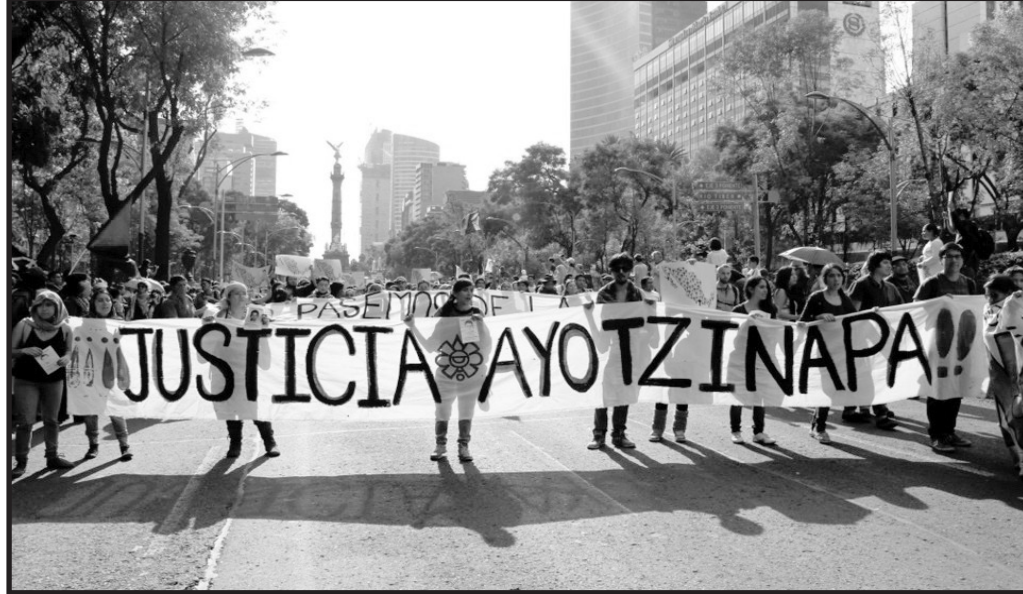
Caso Ayotzinapa demuestra ineficacia de PGR