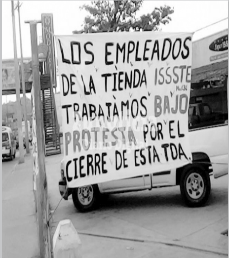
Se inconforman trabajadores de tienda ISSSTE

Empleados de la tienda ISSSTE de Huejutla protestan enérgicamente por el futuro cierre de su fuente de trabajo, lo cual ocurrirá en fecha próxima y que presuntamente los dejará sin el sustento económico para sus familias.